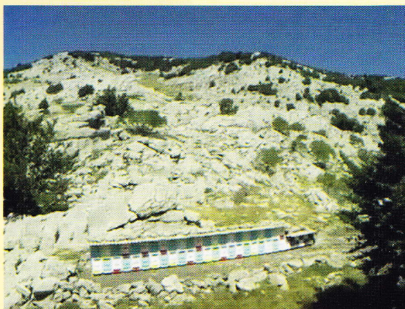
PČELINJAK NA VELEBITU

Još prije nego što je Europska komisija precizirala zakonodavni okvir, riječ „planina” se kao indikator podrijetla već naširoko upotrebljavala u označavanju u cijeloj Europskoj uniji. Pritom su se koristili izričaji iz nacionalnih jezika, često u kombinaciji s engleskom riječi mountain . Valja napomenuti da prema sadašnjoj važećoj regulativi i tumačenju Europske komisije spominjanje određenog imena planine nije obavezno, ali ni zabranjeno. Naravno, u slučaju da