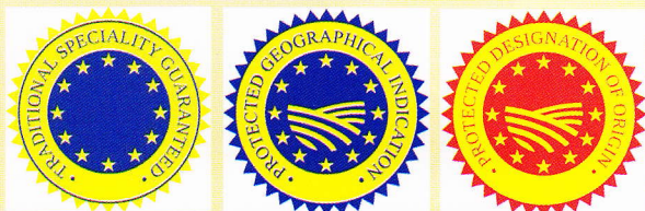
SLIKA 1. OZNAKA ZAJAMČENOGA TRADICIONALNOG SPECIJALITETA, ZAŠTIĆENA OZNAKA ZEMLJOPISNOG PORIJEKLA I ZAŠTIĆENA OZNAKA IZVORNOSTI

od kojih je ova posljednja oznaka ujedno i najvažnija, na tržištu postižu dva-tri puta veću cijenu u odnosu na sličan standardni proizvod.